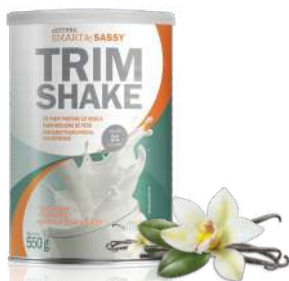
dōTERRA SMART & SASSY® TRIMSHAKE BAUNILHA PÓ PARA PREPARO DE BEBIDA