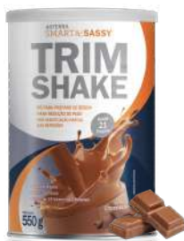
dōTERRA SMART & SASSY® TRIMSHAKE CHOCOLATE PÓ PARA PREPARO DE BEBIDA